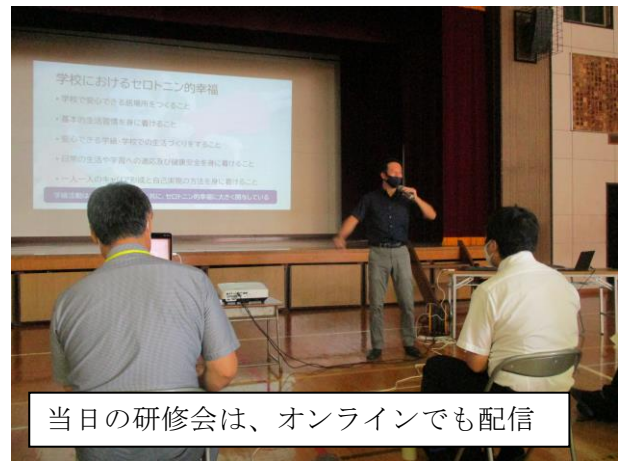
当日の研修会は、オンラインでも配信