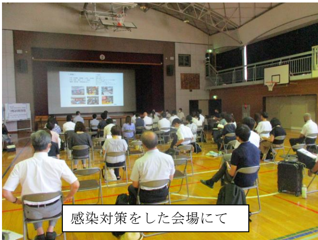
感染対策をした会場にて